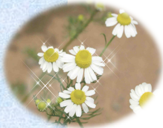
カミツレ (カモミール)